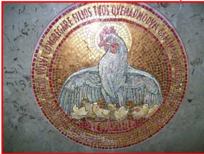
Gerusalemme: Mosaico sull'altare del Dominus flevit

Immaginate i contemporanei di Gesù che lo sentono paragonarsi non a un'aquila, ma a una gallina! Mentre l'aquila ci può incutere timore, rispetto, riverenza, la gallina con i suoi pulcini dà tenerezza.